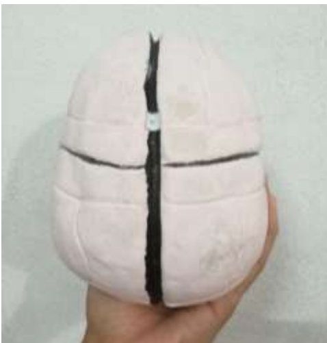
Figura 3 Vista superior