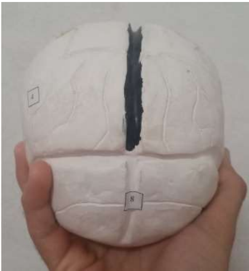
Figura 4 Vista posterior

La figura 3 es una vista superior y la figura 4 una vista posterior. Se pueden observar los detalles más groseros numerados para su identificación y descripción en el material complementario. Los números de la leyenda que aparecen en la última figura son 4 y 8 haciendo referencia a los lóbulos parietales y al vermis respectivamente. Se señalan además otros surcos y giros secundarios y terciarios para profundizar en los contenidos.